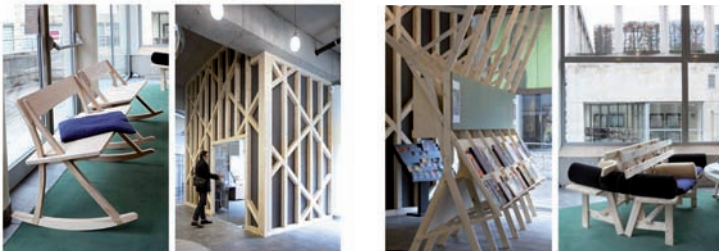
← ↑ Le Point Culture de Liège «relooké» par l'agence Lhoas-Lhoas.