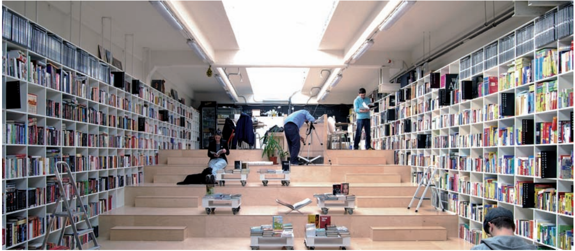
↑ Le même lieu une fois aménagé

nable car leur grande plasticité leur permet d'évoluer en permanence. La bibliothèque est une institution sous influences multiples. Le modèle est en torsion continue, ce qui fait d'ailleurs craindre à certains une perte des fondements. Nous parlons ici des bibliothèques publiques territoriales, à l'exclusion des bibliothèques de conservation.